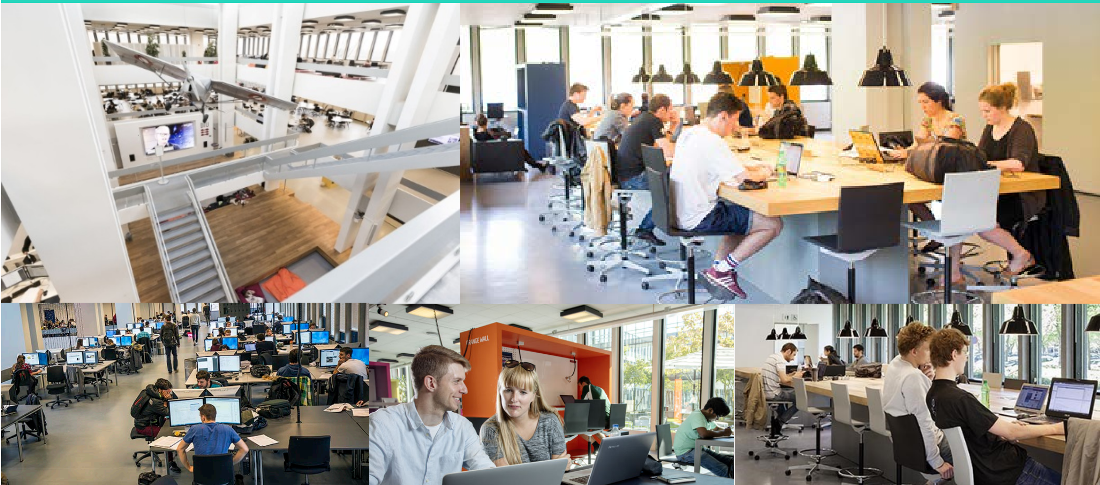
Denmark Technical University Library