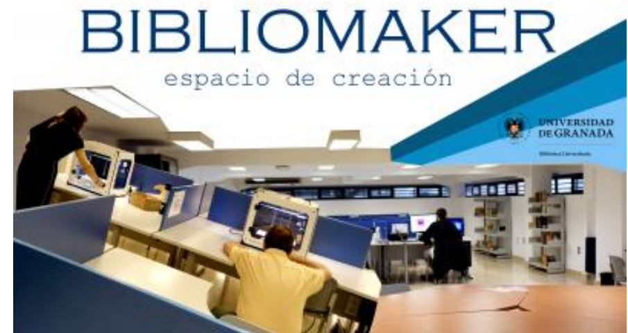
Universidad de Granada, Biblioteca Universitaria.

Lo que se propone en estas pautas es desarrollar proyectos específicos de este tipo en varias de las divisiones de la Biblioteca de la UC que permitan progresar en las competencias de creación y edición digital y de generación de contenidos académicos mediante múltiples tecnologías.