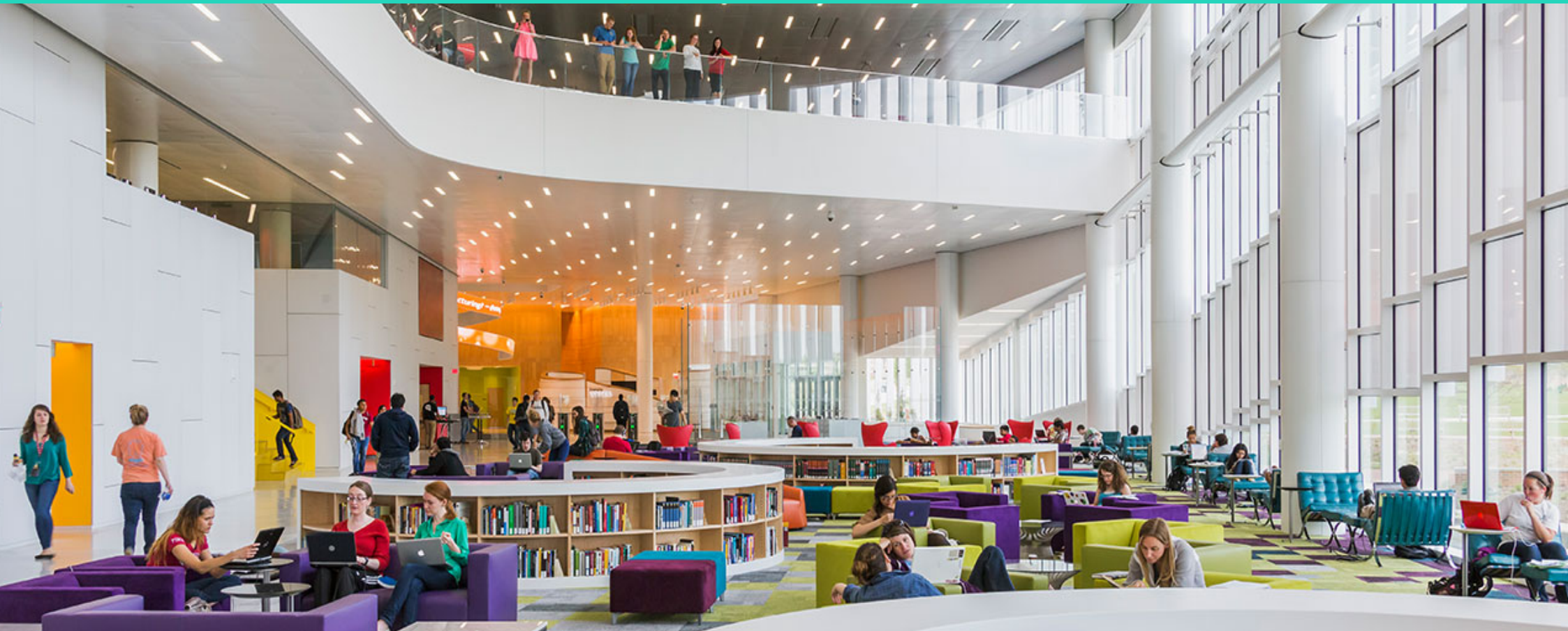
Rain Garden Reading Lounge James B. Hunt Jr. Library North Carolina State University (NCSU) Libraries