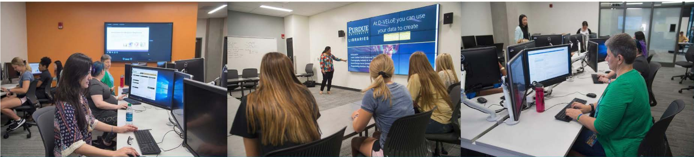
Wilmeth Active Learning Center Library of Engineering and Sciences Purdue University