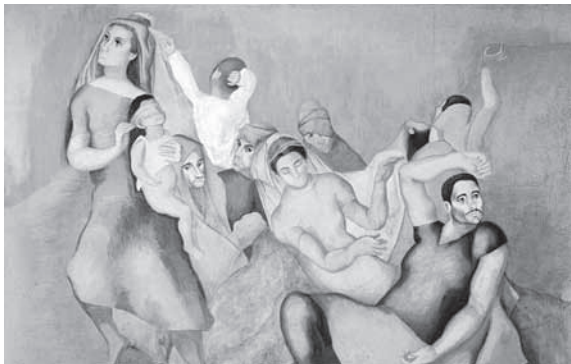
▲ Luis Quintanilla "dolor", 1939

>> Horario de la exposición: de lunes a viernes 10 / 21h. sábados 19 / 21h.