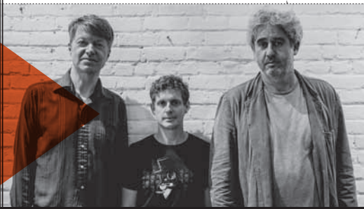
Nels Cline (Wilco) en su BB&C Trio