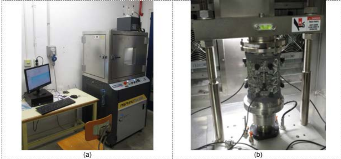
Figura 1. a) Equipo de ensayo; b) ejemplo de disposición durante un ensayo.