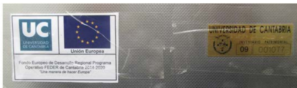
Figura 3. Etiquetas de inventario e identificativa de financiación FEDER en el equipo de ensayo.