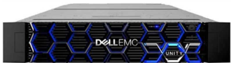
Fig: Unity 350F

Fondo Europeo de Desarrollo Regional (FEDER) "Una manera de hacer Europa"