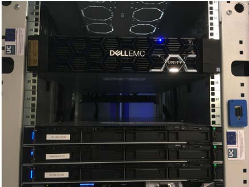
Fig: implantación infraestructura

Fondo Europeo de Desarrollo Regional (FEDER) "Una manera de hacer Europa"