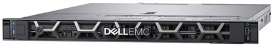
Fig: PowerEdge R440

La solución de almacenamiento está compuesta por una cabina DELL EMC UNITY 350 All Flash . Con una tecnología de disco SSD sobre un backend SAS a 12 GBs . La configuración es la siguiente: