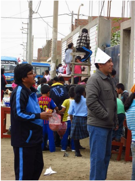
Fig. 12: Pintado del mural en grupo