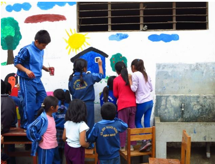
Fig. 10: Pintado del mural en grupo