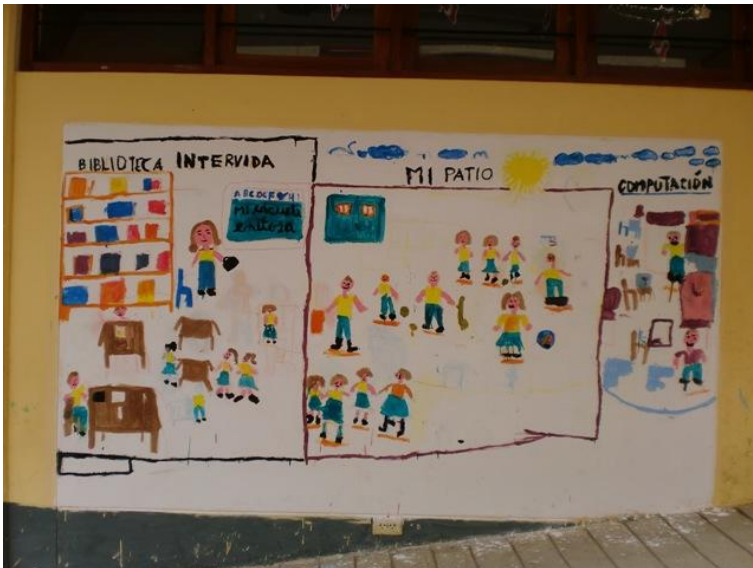
Fig. 16: Aspecto final de los murales