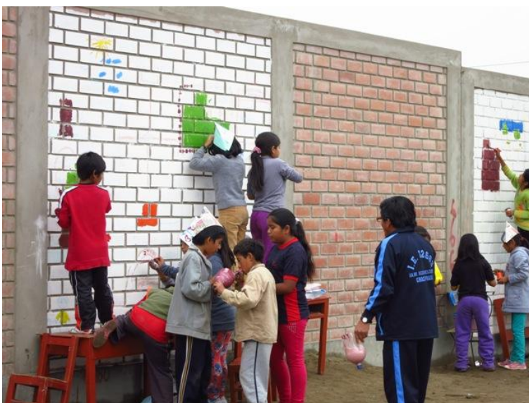
Fig. 11: Pintado del mural en grupo