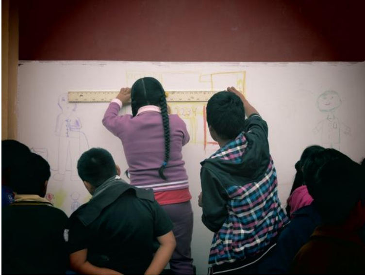
Fig. 9: Dibujo preparatorio en el muro