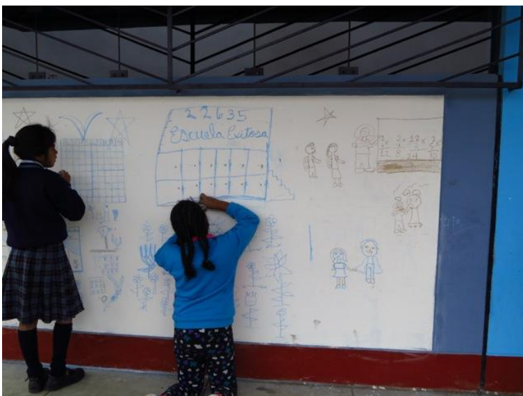
Fig. 8: Dibujo preparatorio en el muro