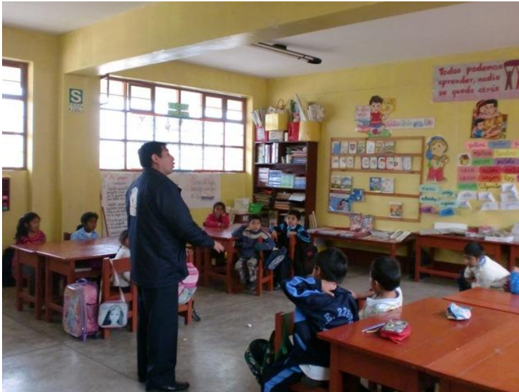
Fig. 3: Diálogo con los alumnos.