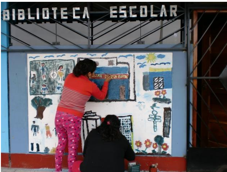
Fig. 13: Madres de familia participando en el pintado de murales.