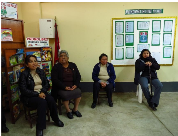
Fig. 1: Reunión informativa con los docentes para explicarles el "Proyecto de pintado de murales"