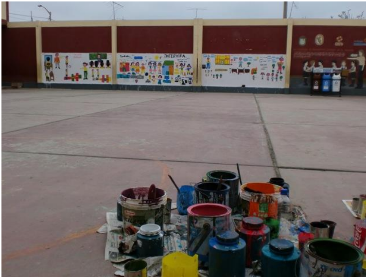
Fig. 15: Aspecto final de los murales