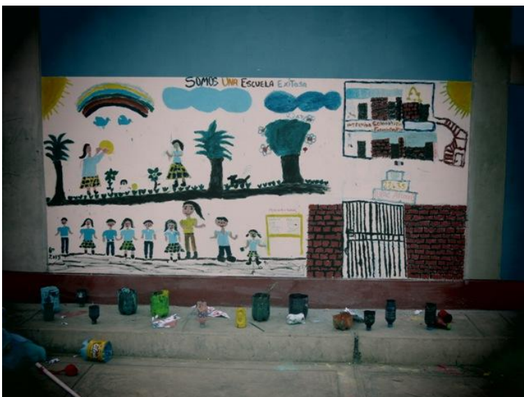
Fig. 14: Aspecto final de los murales