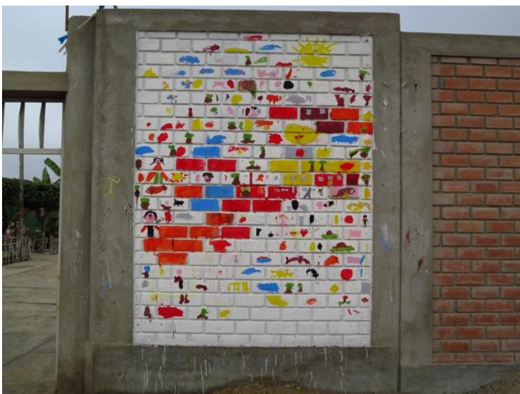
Fig. 17: Aspecto final de los murales