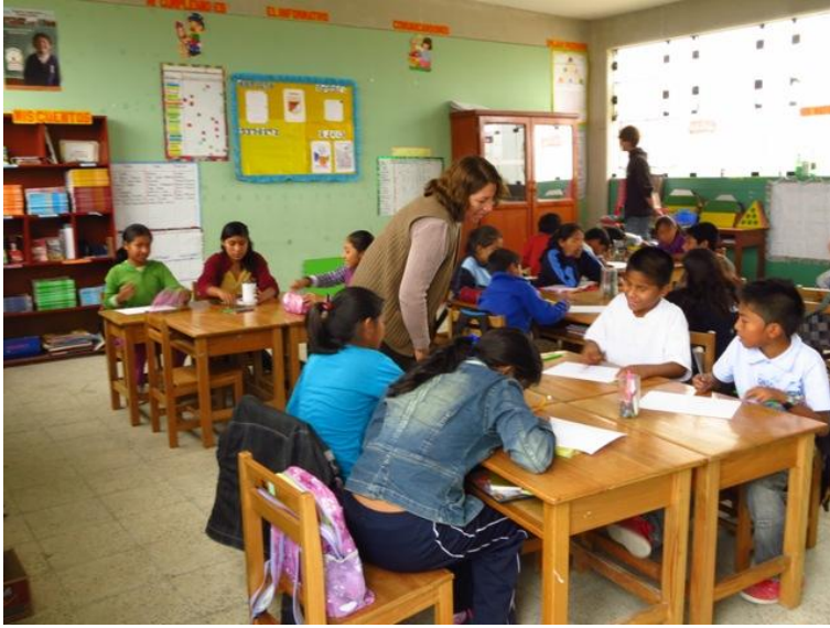
Fig. 6: Trabajo individual