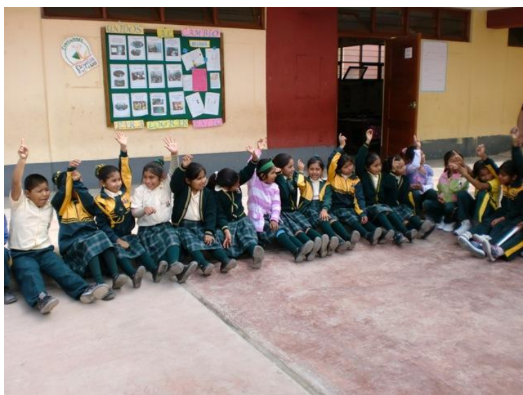
Fig. 2: Diálogo con los alumnos