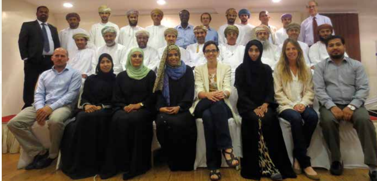
Junio 2014. Taller de análisis de riesgos naturales costeros realizado por el IH en Omán en colaboración con la Comisión Oceanográfica Intergubernamental de la UNESCO (IOC-UNESCO).

en torno al sector portuario y el transporte marítimo, que se llevan a cabo junto con Puertos del Estado, la Autoridad Portuaria de Santander y la UIMP en el marco del Centro Internacional de Tecnología y Administración Portuaria (CITAP), entre las que destaca el desarrollo de la XIV Edición del Curso Iberoamericano de Tecnología, Operaciones y Gestión Ambiental en Puertos o la VII Jornada de Innovación en el Clúster Portuario .