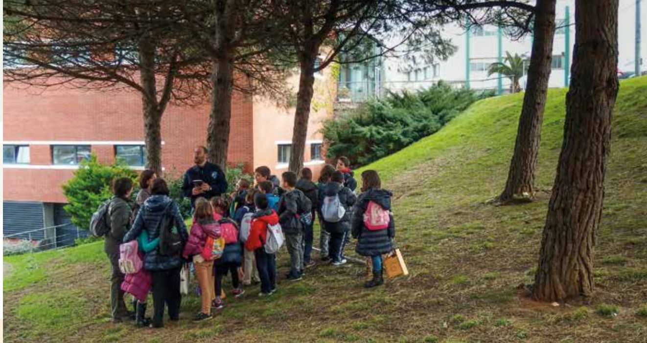
Colocación de cajas nido en el campus con participación de grupos escolares.

El Campus de Excelencia prioriza además la sensibilización de la comunidad universitaria en materia de desarrollo humano y sostenible. En el curso 2013/2014, a través del Programa de Voluntariado de la UC, dirigido a toda la comunidad universitaria y gestionado por el Área de Cooperación Internacional para el Desarrollo (ACOIDE), ha ampliado el número de instituciones y organizaciones adheridas al mismo así como la tipología de voluntariado que se oferta, con la integración del voluntariado medioambiental a través de las actividades del Programa Provoca del Gobierno de Cantabria y la Oficina Ecocampus o el lanzamiento del proyecto de voluntariado internacional.