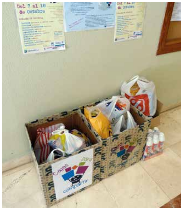
Campaña solidaria "Cajas para compartir".