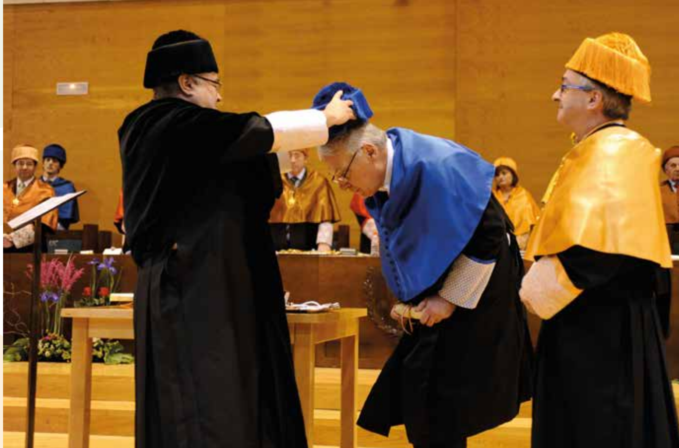
El catedrático de Estadística, Peter Hall, investido Doctor Honoris Causa de la UC.

Entre esos ponentes, se contó con Peter Hall, catedrático de Estadística y uno de los mayores especialistas en el área del mundo, quien fue nombrado Doctor Honoris Causa de la UC en enero de 2014, a propuesta de los dos departamentos de matemáticas y como muestra también de los extraordinarios enlaces internacionales con los que cuentan los profesores e investigadores del área de la UC.