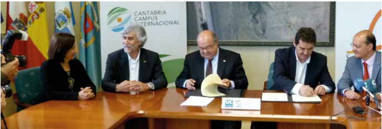
Firma del convenio de cesión de espacios de la ETS de Náutica para el Mundial de Vela Santander 2014.

El equipo de gestión CCI desempeña su labor con un doble enfoque: hacia adentro, en lo relativo a las medidas y acciones directamente vinculadas con la comunidad universitaria; y especialmente hacia afuera, como facilitador de las relaciones con el sector privado para la ejecución de determinados proyectos, fruto de la acción conjunta y la suma de competencias. La visión de la Oficina de Gestión CCI es hacer efectiva una de las principales funciones de la Universidad: la de fomento de la excelencia, la internacionalización y la colaboración activa con todos los agentes e instituciones generadores de conocimiento como medio efectivo de desarrollo social.