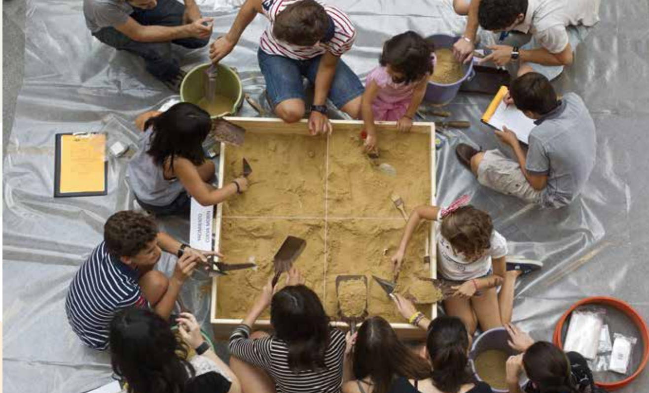
Actividades en el Paraninfo en la UC en la Noche de los Investigadores.

En este contexto es en el que la Universidad de Cantabria ha alcanzado el segundo puesto en calidad científica por Impacto Normalizado en el prestigioso ranking de SCImago 2014, con un índice de 1.57 y un total de 4.363 artículos, teniendo en cuenta a todas las universidades españolas con más de 1.000 artículos publicados. Estos datos condensan la producción científica entre los años 2008 al 2012 y mejoran la quinta posición en que se ubicaba la UC en este indicador con respecto al ranking de 2013. Además, en lo que respecta al indicador que mide el Ratio de Excelencia, en 2014 la UC ocupa la tercera posición, con un 16.21, con lo que nuestra universidad supera en este indicador a otras universidades mayores, más antiguas y con más recursos económicos. Por otro lado, cabe destacar que la UC ha realizado en este curso un análisis estratégico de los rankings universitarios , índices que están adquiriendo una importancia creciente en la política universitaria, de cara a analizar el posicionamiento de la universidad y las oportunidades de mejora que tiene la institución.