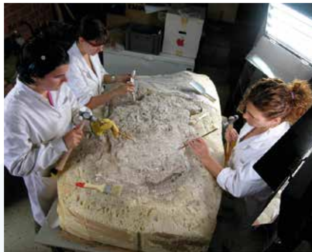
Laboratorio del Instituto Internacional de Investigaciones Prehistóricas de Cantabria.

En el eje de Patrimonio , se han mantenido los esfuerzos por mantener la calidad científica, la capacidad de captación de talento y el éxito en el acceso a financiación competitiva por parte del Instituto Internacional de Investigaciones Prehistóricas (IIIPC) , que sigue siendo el motor de la excelencia internacional del área. El Instituto mantiene su liderazgo y proyección exterior, que se refleja en el desarrollo actual de importantes proyectos de investigación en más de 7 países. Destaca la organización de varios congresos y jornadas internacionales como el Simposio Iberoamericano de Arqueología Espacial o el Encuentro internacional "Patrimonio cultural y conflictos". Finalmente, el IIIPC ha hecho un esfuerzo muy importante en materia de divulgación científica y difusión del conocimiento, en el que destaca su participación, junto con el resto de las áreas de CCI, en la Semana de la Ciencia y la Noche de los Investigadores.