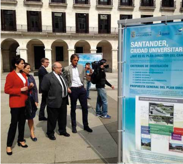
Mayo 2014. Exposición "Santander, ciudad universitaria" en colaboración con el Ayuntamiento de Santander.

del Campus de Excelencia como la exposición "Santander, ciudad universitaria", en colaboración con el propio Ayuntamiento.