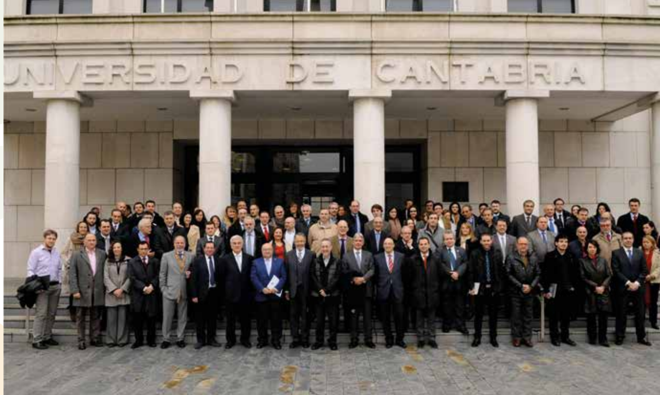
Más de 100 personas asistieron al plenario del Foro UC-Empresas, celebrado en marzo de 2014.

de Excelencia Internacional y gira en torno al Instituto de Hidráulica Ambiental (IH Cantabria), centro mixto de investigación que desempeña una ingente labor investigadora, de transferencia tecnológica y de formación de especialistas.